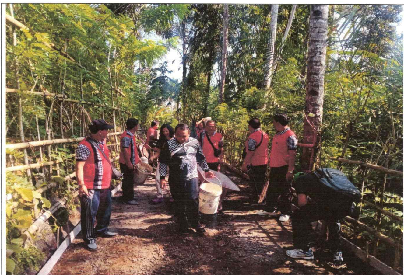
Kegiatan Gotong Royong Perangkat Desa