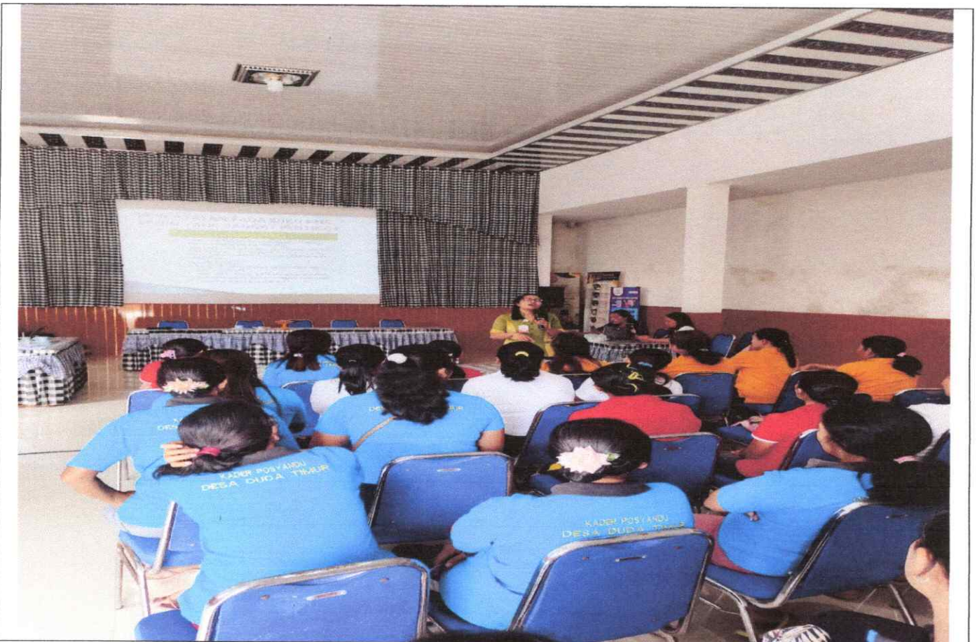
Peningkatan kapasitas kader posyandu