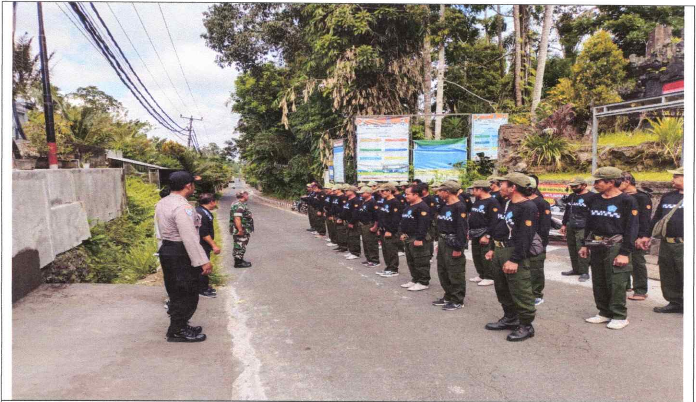
Dokumentasi peningkatan kapasitas Linmas