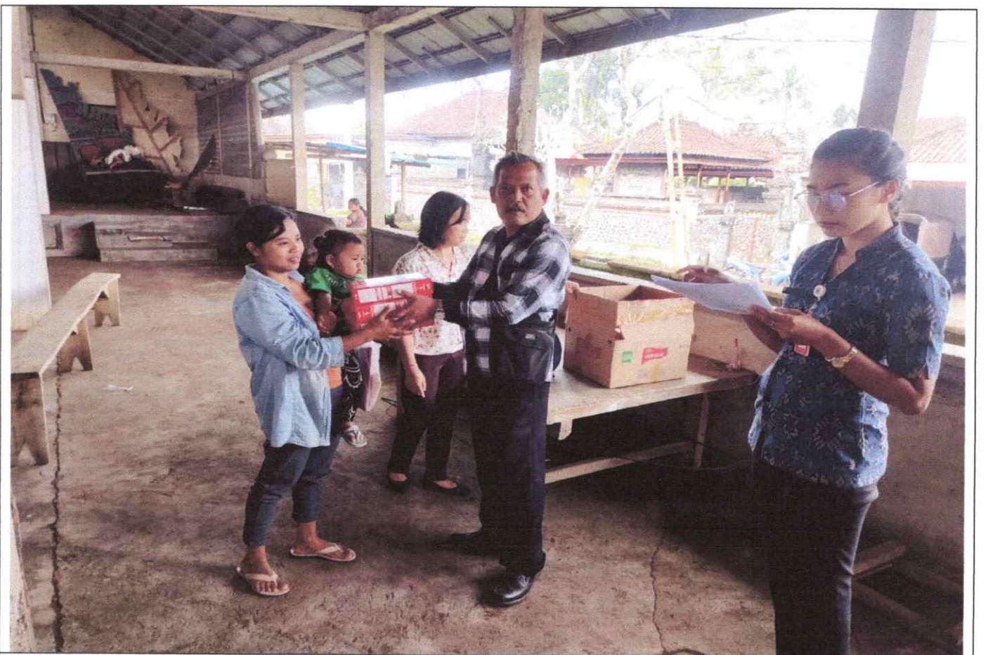
Penyerahan bantuan bagi balita stunting