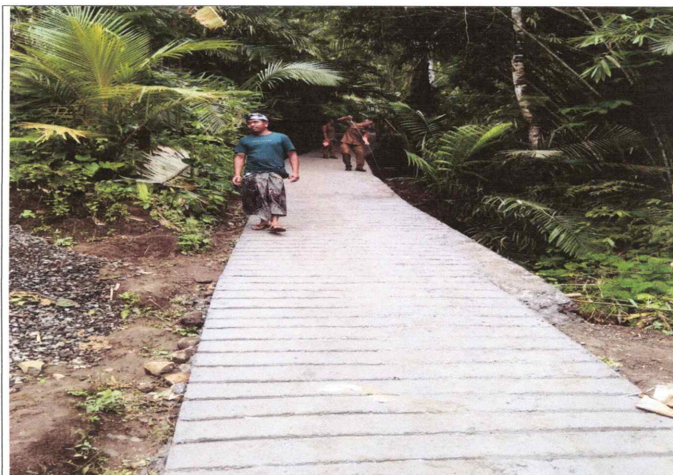
Kegiatan Rabat Beton Jalan Arya Tan Kaur