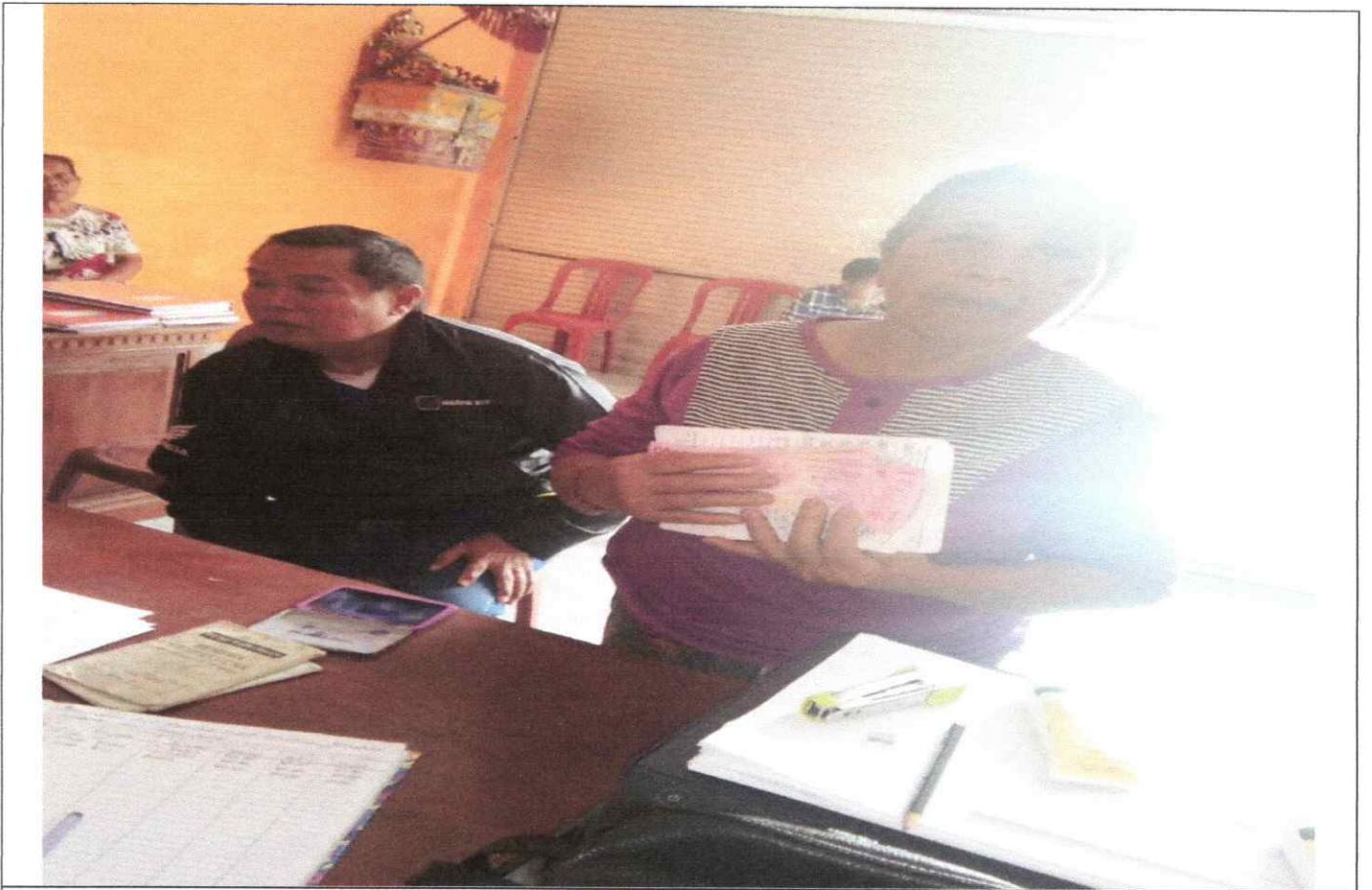
Penyerahan bantuan BLT DD bagi KPM